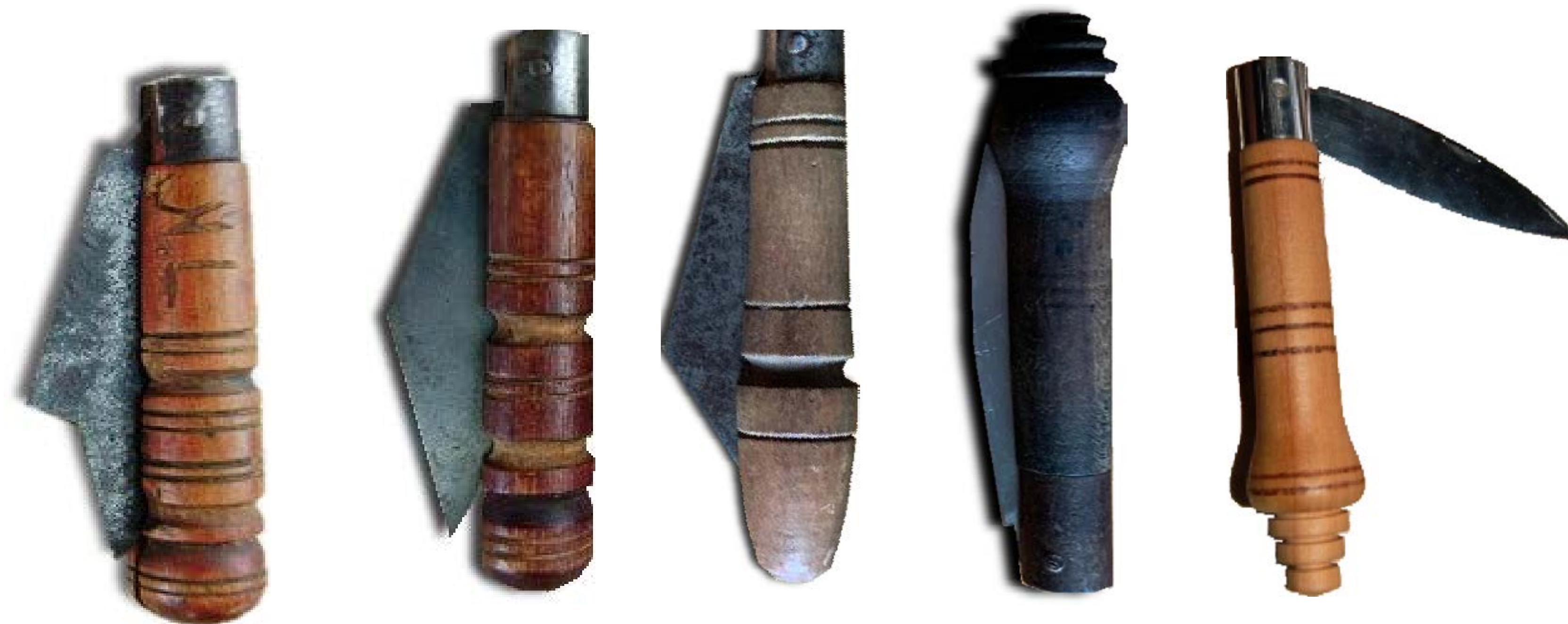
Ukázka dochovaných tradičních křiváků