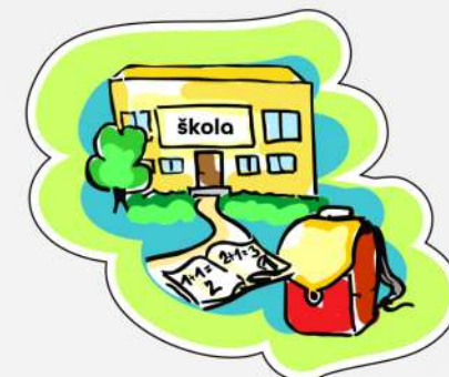
škola / školka