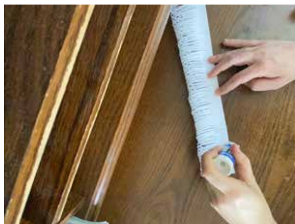
Naneste lepidlo na spodný okraj.