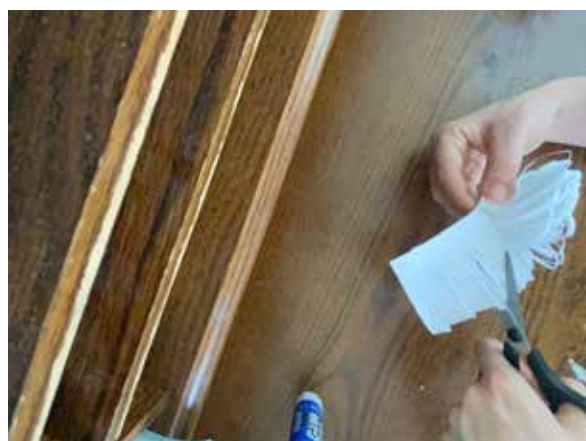
Odstrihnite zvyšný koniec.