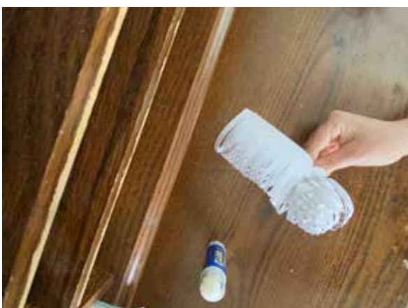
V takejto vzdialenosti od konca prestaňte rolovať.