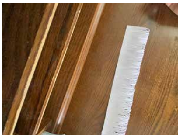
Vznikne Vám takáto rúrka.