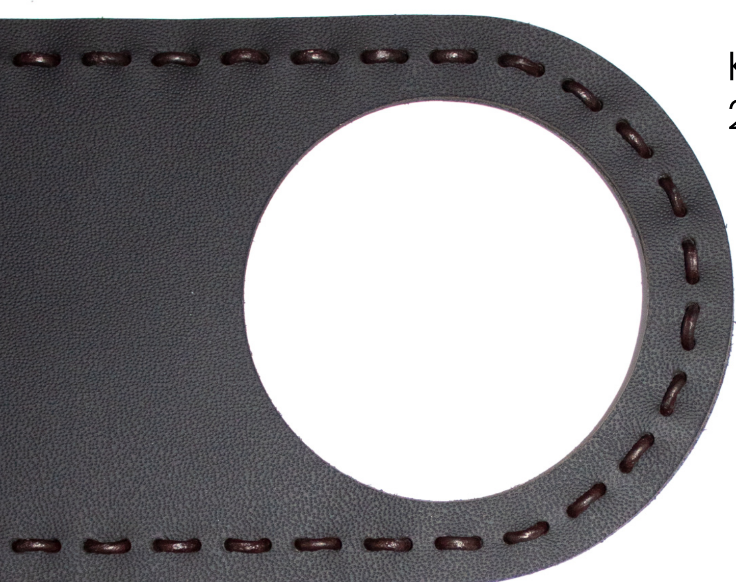
Kulatý kožený řemínek 2 mm

Láhev se dovnitř vkládá boční stranou obalu. Krk láhve se zasune mezi dva pláty kůže, které jsou spojeny koženým řemínkem nebo černou bavlněnou nití a dno láhve se vloží do kruhové prohlubně ve dřevě. Láhev je v obale pevně zafixovaná dobře chráněna.