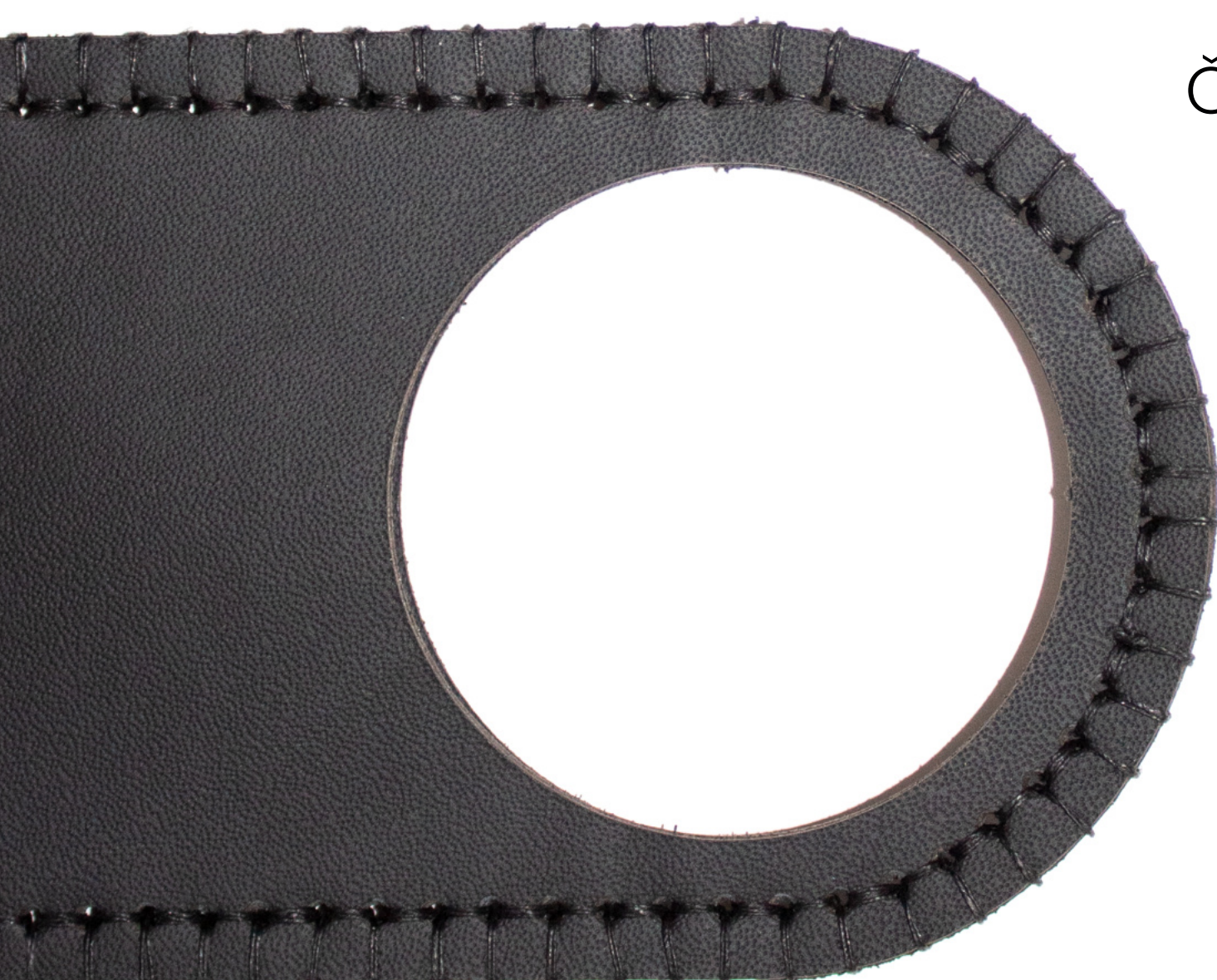
Černá hrubá nit