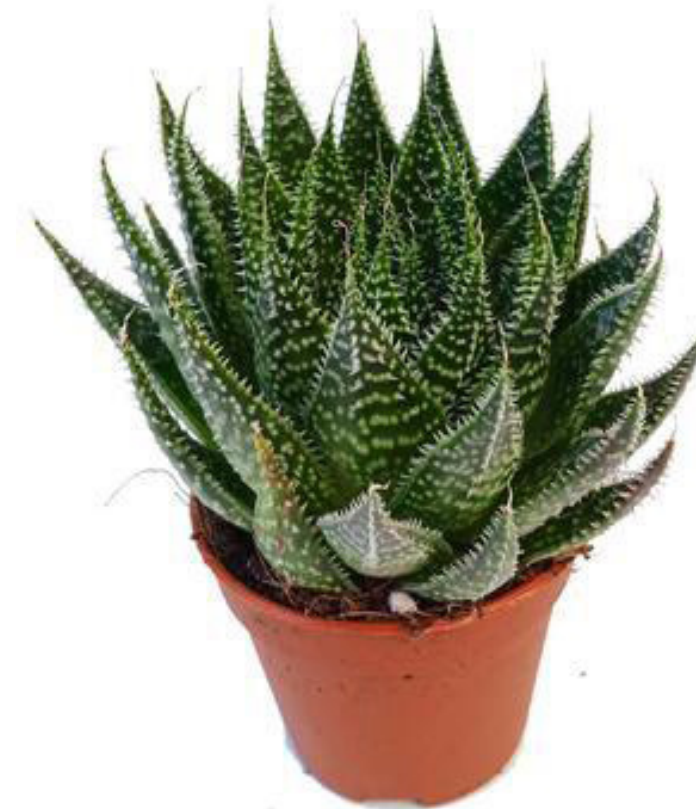
Sukulent, kaktus průměr květináče: 5,5 cm cena: 70 Kč