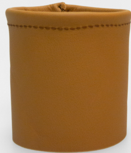
Kožený květináč průměr: 5,5 cm výška: 6 cm