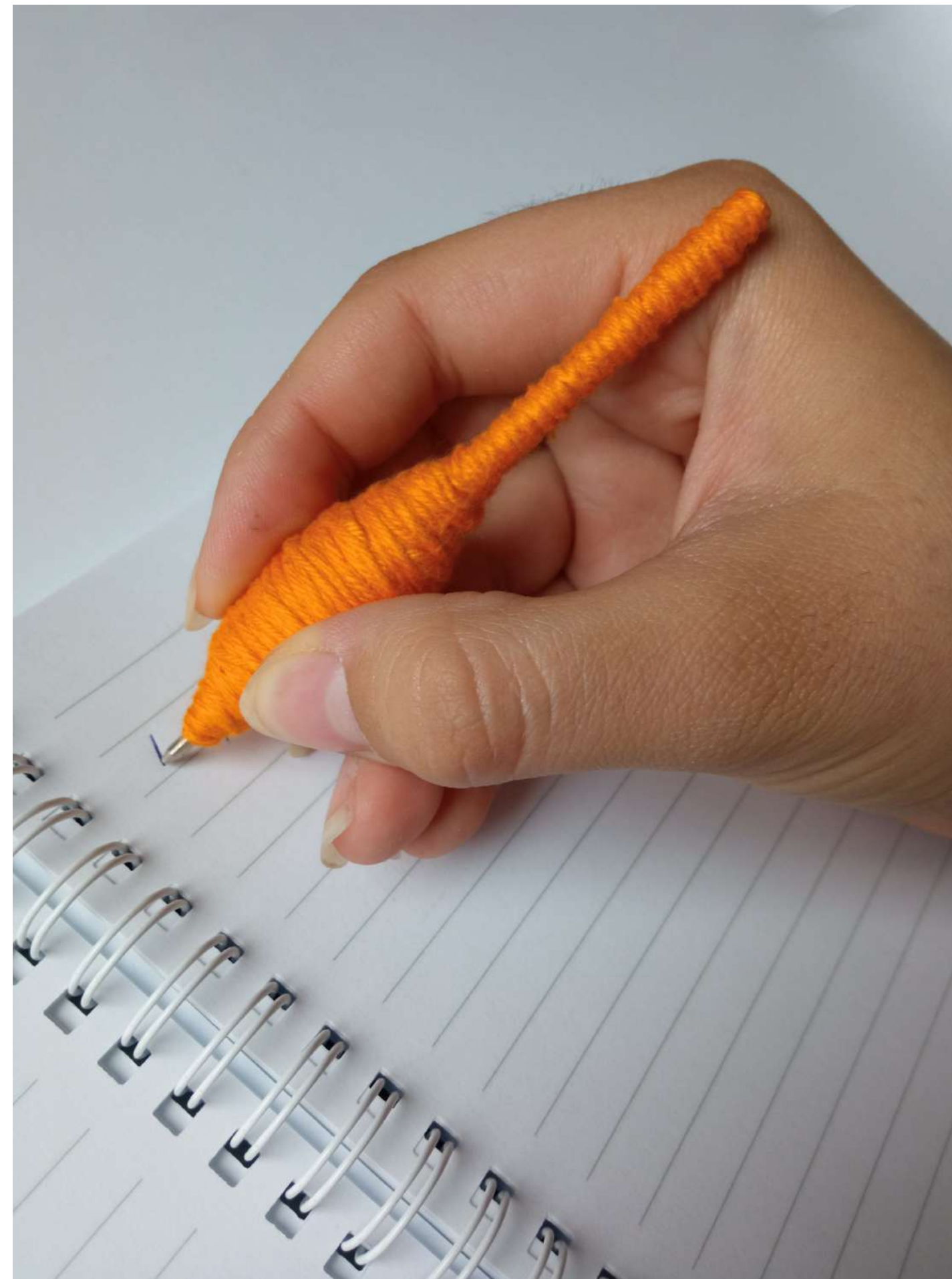
PETRA OCHODNIČANOVÁ ADE 2022/2023 1. ROČNÍK BC.