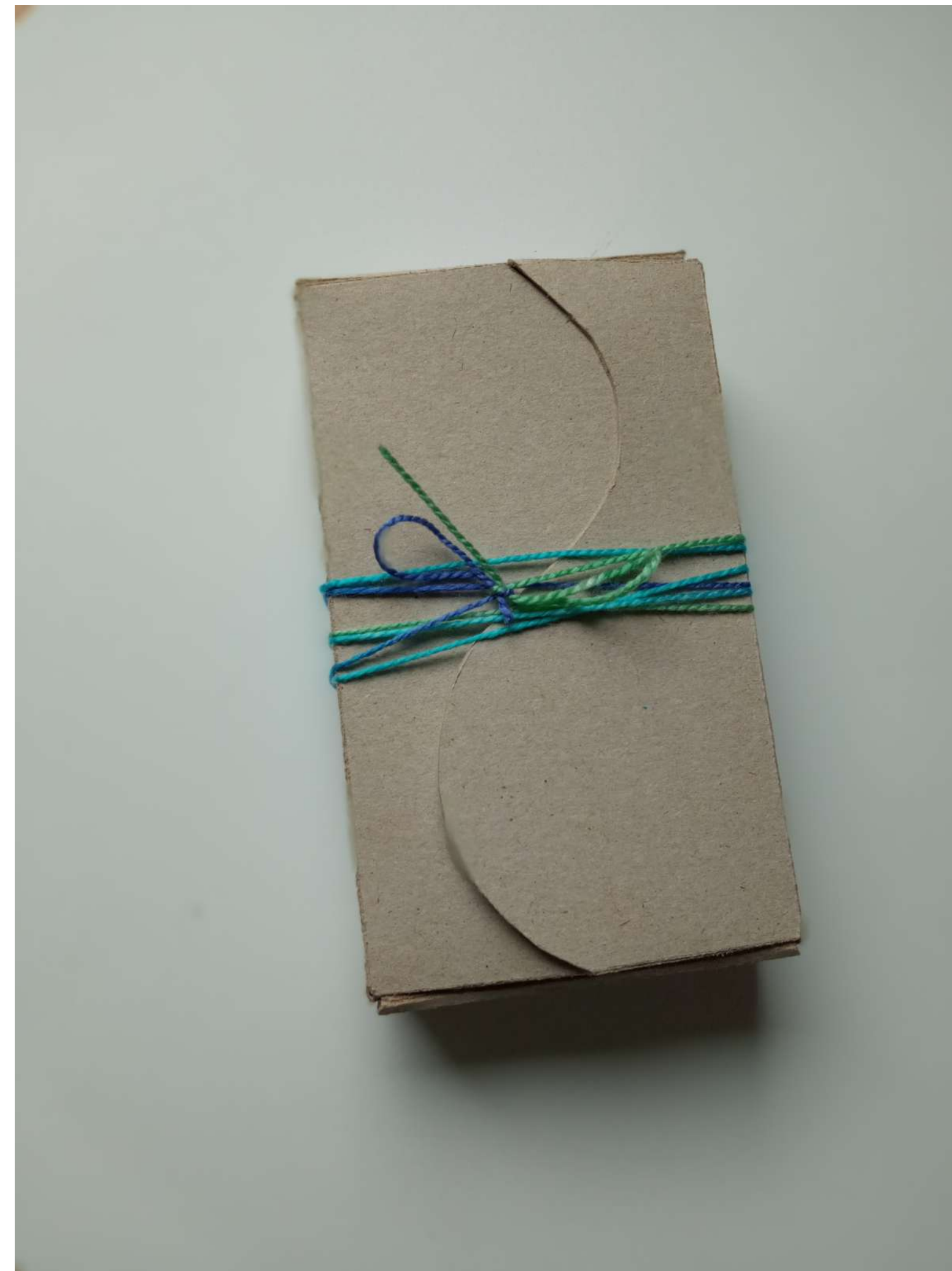
PETRA OCHODNIČANOVÁ ADE 2022/2023 1. ROČNÍK BC.