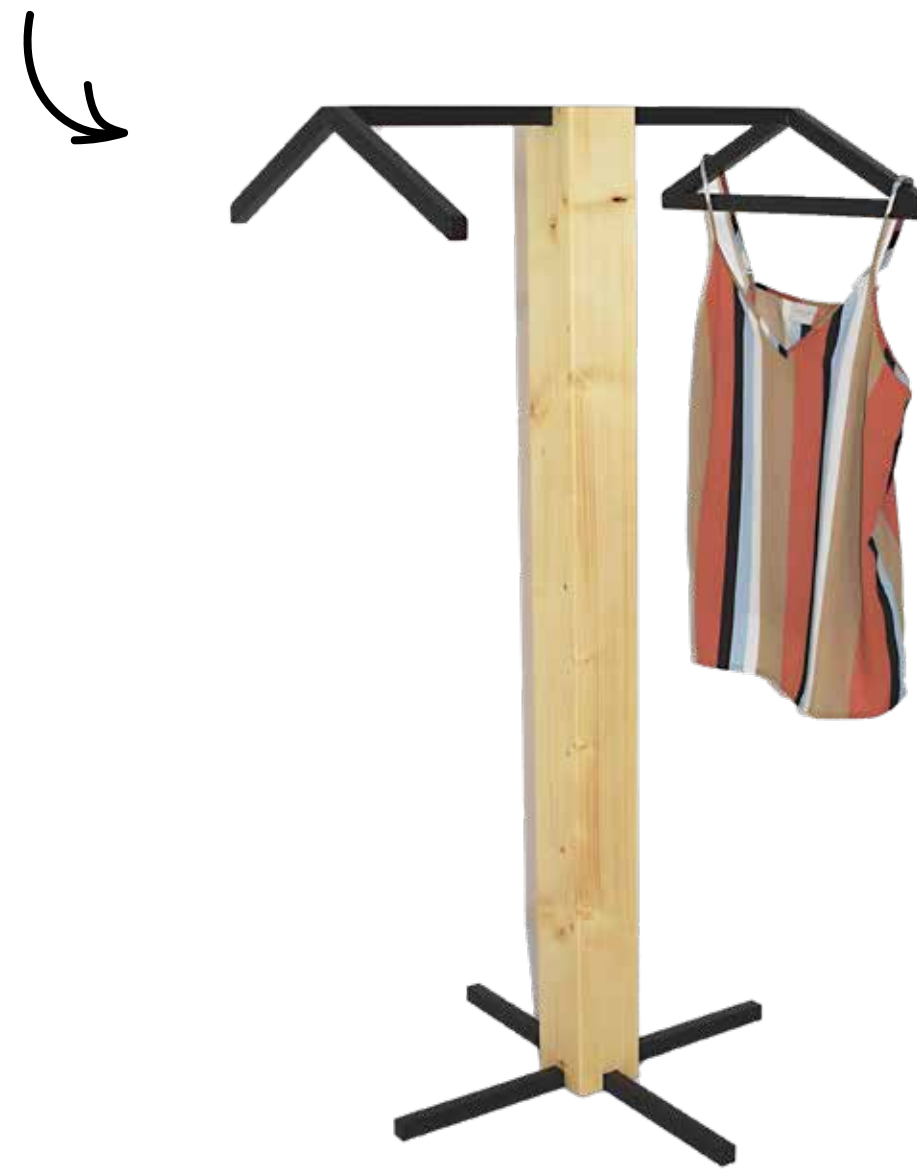
němý sluha č.1