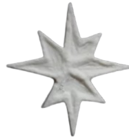
bílý litý porcelán