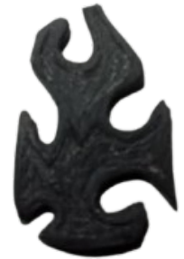
černý modelovací porcelán